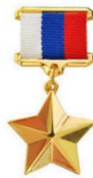
Медаль Героя России